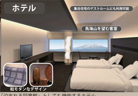
「泊まれる図書館」としても機能するホテル