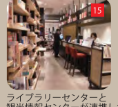
ライブラリーセンターと観光情報センターが連携した一体型カウンター