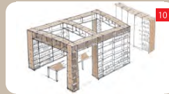
打ち合わせができる「ビジネス向けスペース」