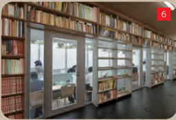
集中して学習「静寂閲覧スペース」