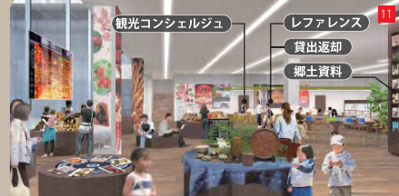
ライブラリーセンターの郷土資料コーナーと連携した「観光情報センター」