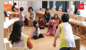
親子で安心「読み聞かせコーナー」