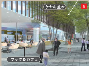
緑あふれる 気持ちの良い「ブック&カフェ」