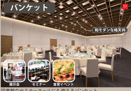
図書館のセミナーホールにも使えるバンケット