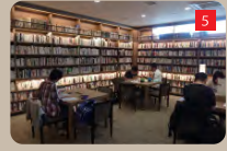
調べものに最適な「本に囲まれた閲覧席」