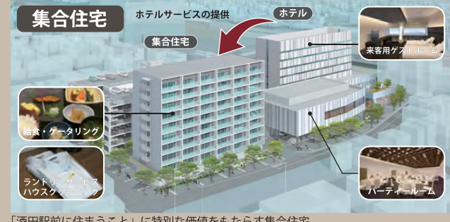
「酒田駅前に住まうこと」に特別な価値をもたらす集合住宅