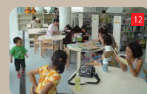
児童の放課後の居場所「児童図書コーナー」