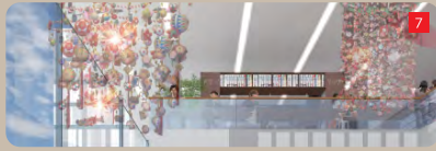
幸福に囲まれた「閲覧カウンター」