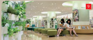
充実した 閲覧休憩ベンチ