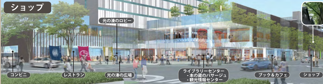
「光の湊」はさまざまな活動や賑わいかにじみ出し明日の酒田を照らす道しるべになります