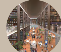
本の蔵のバサージュ