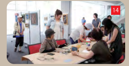
うるさくしても大丈夫「わいがやルーム」