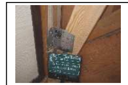
筋かい金物設置例

※ 耐震改修工事と併せて、増築工事、改築工事、現行法令に適合しない部分を適合するように是正する工事、修繕工事、模様替え工事等を行う場合の工事費用は対象になりません。