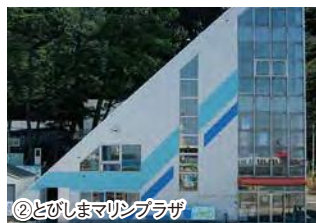
②とびしまマリンプラザ